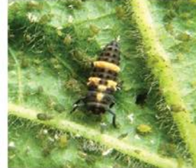
ढालकिड्याच्या विविध प्रजातीचे प्रौढ व अळ्या